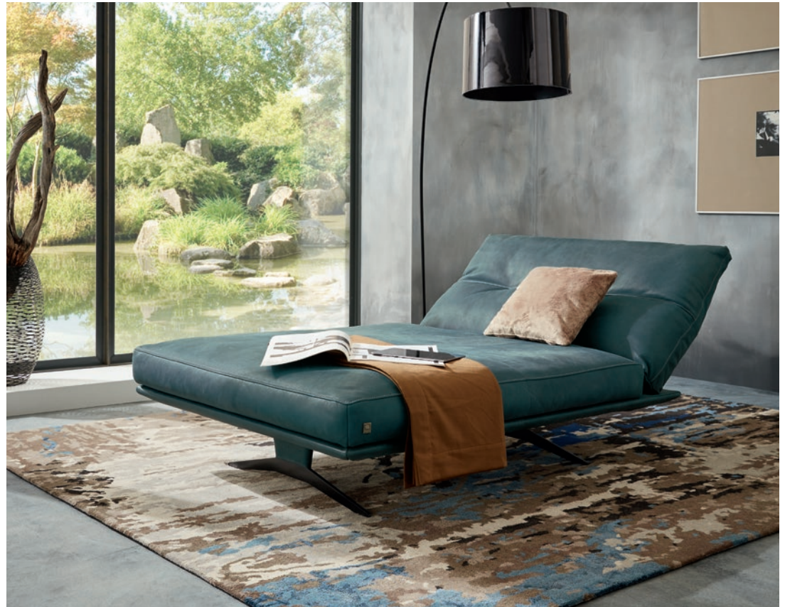
MR 495 Longchair (P) , frei stellbar, in Leder azur mit Kontrastfaden in Hellgrau, Metallkufe Nr. 4 in Nickel satiniert (Edelstahloptik), ca. B 120, H 73 – 93, T 157 – 190, SH 43, ST 126 – 130 cm