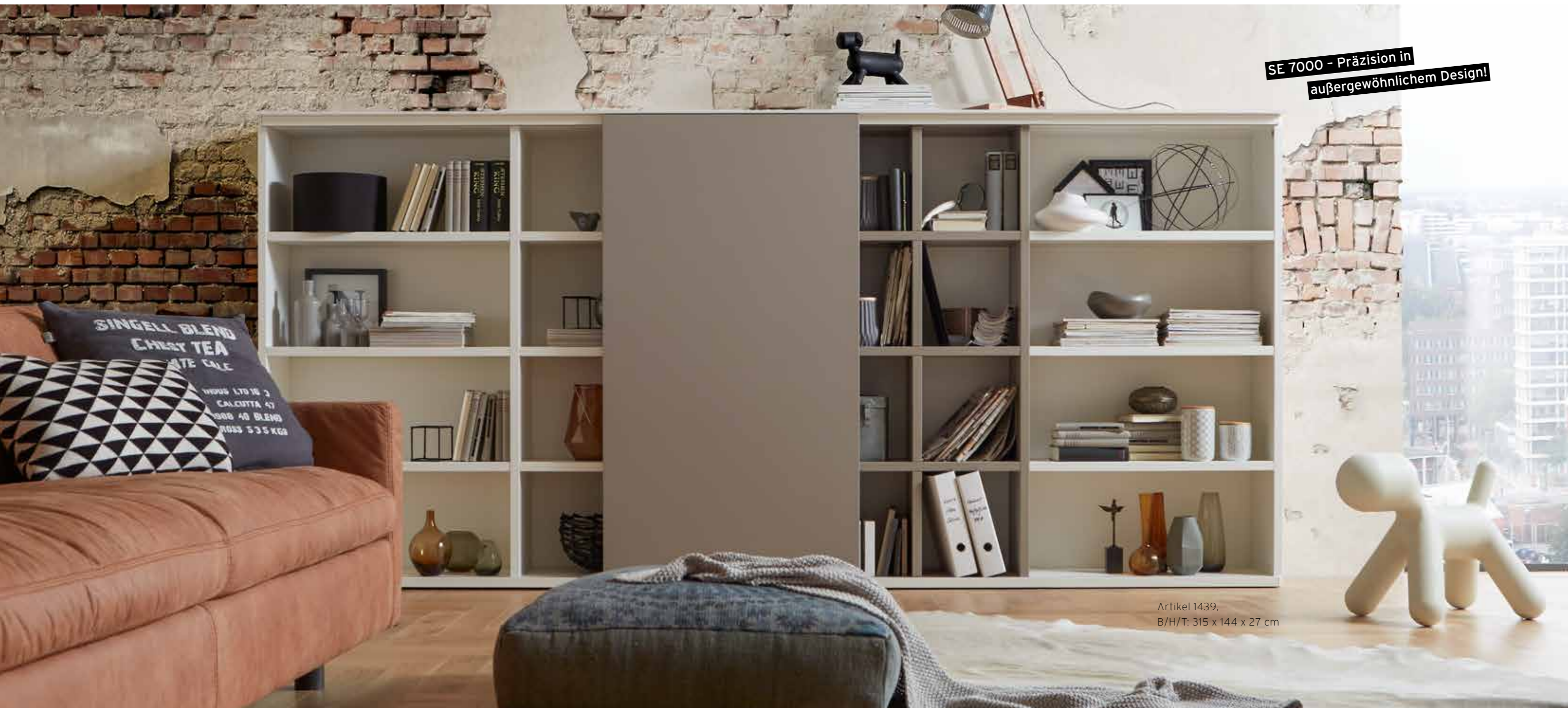
Artikel 1439, B/H/T: 315 x 144 x 27 cm

SE 7000 - Präzision in außergewöhnlichem Design!