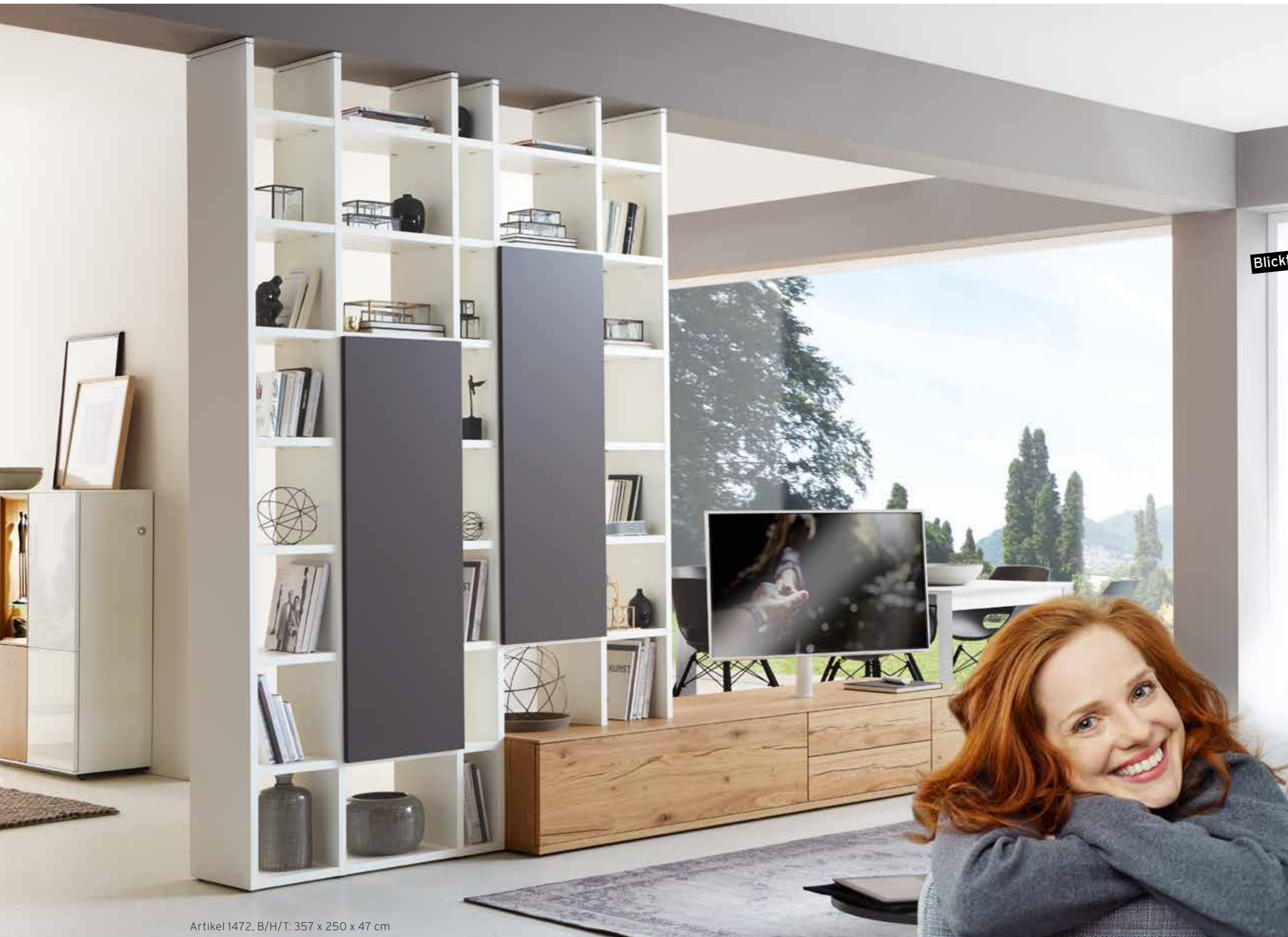
Artikel 1472, B/H/T: 357 x 250 x 47 cm

Wenn Ihr persönlicher Lebensstil in den eigenen vier Wänden erkennbar ist, dann könnte es an Ihrer Leidenschaft für eine flexible Raumgestaltung mit extra viel Liebe zum Detail liegen. SE 7000 im Farb- und Materialmix kommt da wie gerufen.