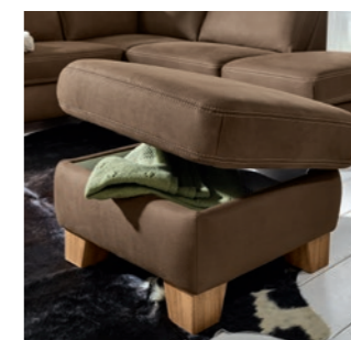
Hocker mit Stauraum Stool with storage space