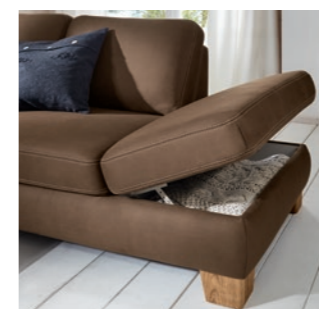
Eckelement mit Stauraum, Holzfuß Eiche geölt Corner element with storage space, wooden leg in oiled oak