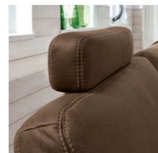
Kopfstütze , variabel einsteckbar Headrest, slots in variably