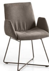
Armlehnstuhl | Carver MEX

MR 2050 | T 2050 Sie harmonieren einfach miteinander und wirken wie eine Einheit: die Sitzmöbel MR 2050 und die Tische T 2050. Variantenreich und individuell lässt sich jeder Essplatz bei jedem Raumangebot gestalten. Nicht nur optisch gilt: Es passt immer!