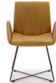
Armlehnstuhl | Carver MEX