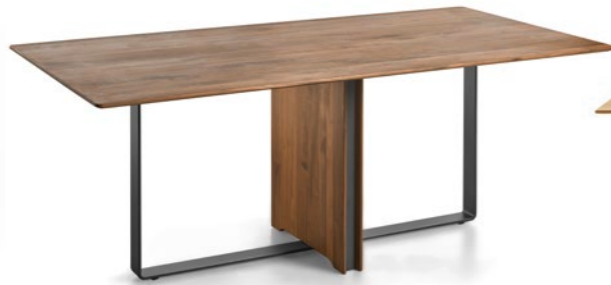
Esstisch | Dining table 7883-79-080