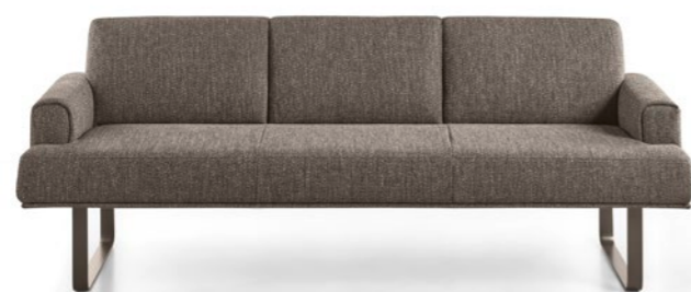
Bank | Bench B190

On request, the seams can also be sewn in a contrasting yarn.