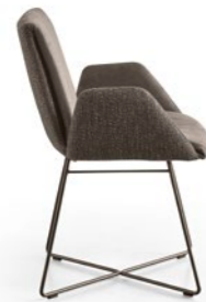
Armlehnstuhl | Carver MEX