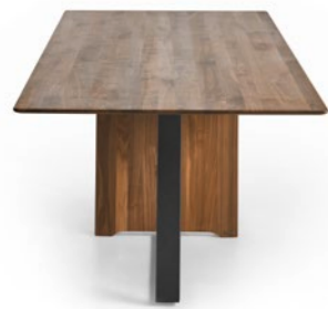
Esstisch | Dining table 7883-83-080