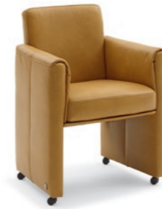
Sessel | Armchair M