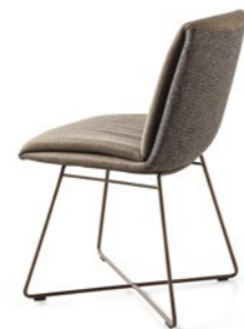
Stuhl | Chair MX