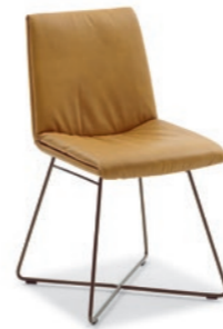
Stuhl | Chair MX