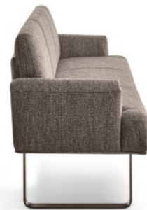
Bank | Bench B190

MR 2050 | T 2050 They simply harmonise with each other, and seem like a single unit: the seating furniture MR 2050 and tables T 2050. Each dining area can be created with plenty of variety and individually to suit the available space. The general rule – not just in looks: always a perfect fit!