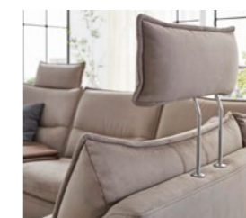
Ausziehbare Kopfstütze: Zusätzlich kann die Neigung des Kopfteils individuell angepasst werden

Continuously adjustable folding armrest, operated manually