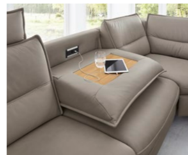
Funktionsablage mit Steckdose und USB-Ladeanschluss Functional shelf with socket and USB charging connection

Relaxessel MR 251 , medium, in Leder anthrazit, mit manueller Verstellung, Sternfuß aus gebürstetem Edelstahl, ca. B 73, H 112, SH 47, T 91–180, ST 52 cm