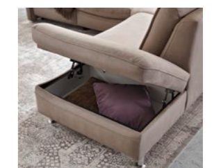
Praktischer Stauraum: Der Anstellhocker des Anreihsofas ist auf Wunsch aufklappbar

Pull-out headrest: in addition, the headrest tilt can be adjusted individually