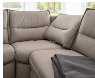
Gemütliches Relax-Eckteil Cosy relax corner section