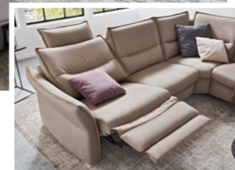
Anreihsofa mit motorischer Wall-Away-Funktion

Add-on sofa with motorised Wall-Away function