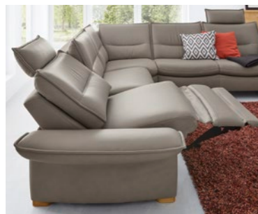
Anreihsofa mit Wall-Away-Funktion Add-on sofa with Wall-Away function