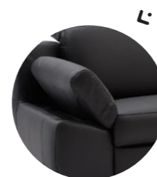
Verstellbare Armlehnen (B = BASIC)

Sofa BB220 , 2-sitzig, mit verstellbarer Armlehne BASIC, ca. 30 cm, festes Rückenpolster mit manueller und stufenloser Kopfteilverstellung (1E, 2E), Leder Montana Black, Ziernaht Ton in Ton, Sitzhöhe M, Metallfuß 01BR brushed, ca. B 220, H 83-101, SH 46, T 100, ST 54 cm