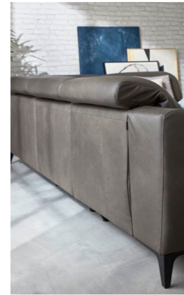
Rückenansicht des Recliners mit und ohne Betätigung der elektrischen „MAXRELAX“-Sitzverstellung